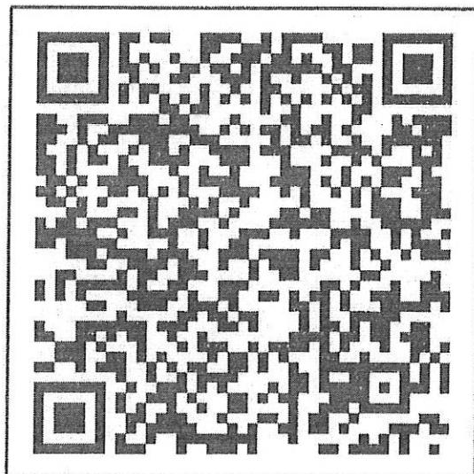
สแกน QR-Code เพื่อสมัครเข้าประกวด