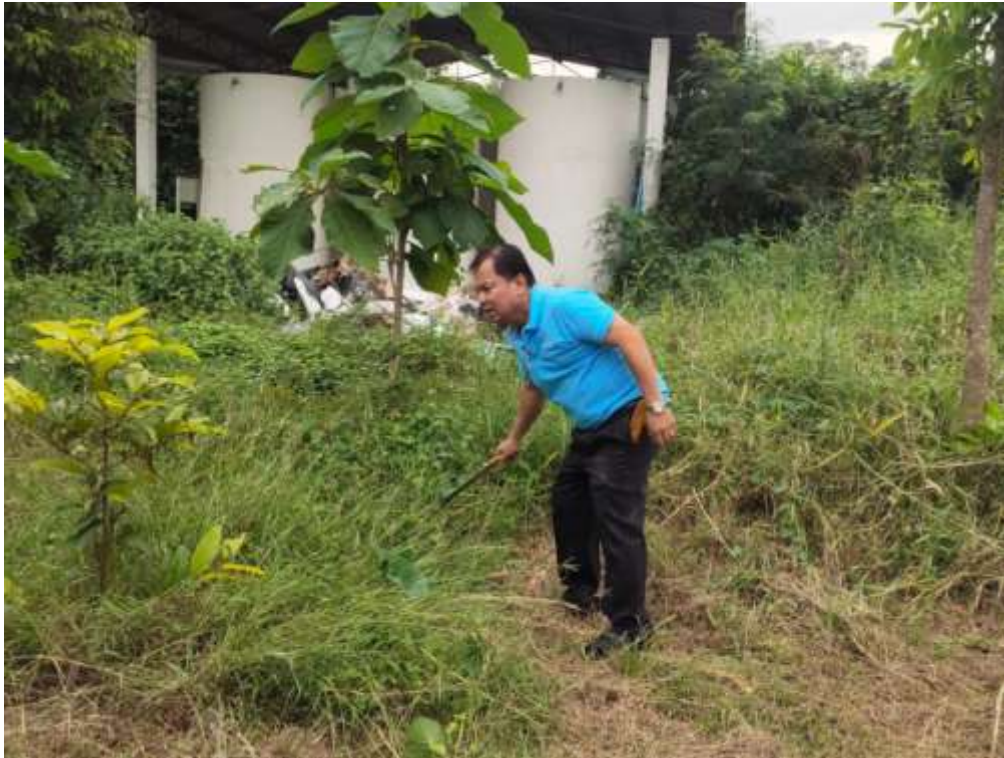
รัชศิลป์ อบต.บ้านม่วง