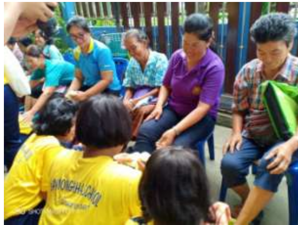
การเตรียมความพร้อมของผู้สูงอายุ